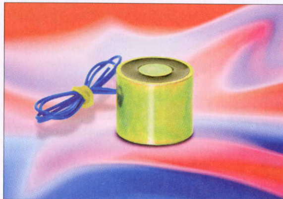
Bild 1: Der MS2015 ist ein vollverkapselter Standardelektromagnet

Geräte wie Verkaufsautomaten, Kreditkartenleser, Registrierkassen, Haushaltsgeräte, aber auch industrielle Produktionsanlagen, Warenfluss-Systeme, Sicherheitsvorrichtungen und vieles andere mehr sind die typischen Anwendungsgebiete von Elektromagneten. Alle diese Geräte besitzen eine Steuerungselektronik, deren Logik mechanische Aktionen auslösen muss. Wenn diese in der Ausübung einer mechanischen Kraft oder einer linearen Bewegung über kurze Distanzen bzw. Drehung besteht, kann man auf Elektromagnete nicht verzichten. Sie führen wichtige Funktionen aus, in dem sie bewegen, heben, öffnen, schließen, verriegeln, halten oder drehen. Im Vergleich zu anderen Antrieben wie z. B. Schritt- oder Linearmotoren sind sie in vielen Anwendungsfällen die einfachere und kostengünstigere Alternative. So vielfältig die Aufgaben der Elektromagnete sind, so unterschiedlich sind deren Bauformen, Abmessungen und technische Daten. So gibt es beispielsweise Haltemagnete, Linearmagnete, Klappenmagnete, Rotationsmagnete und Ventilmagnete. Für viele Anwendungen eignen sich Standardtypen, die mit definierten mechanischen und elektrischen Eigenschaften in großen Stückzahlen produziert werden ( Bild 1 ). Bei der Auswahl empfiehlt es sich, auf das umfangreiche Angebot zu-